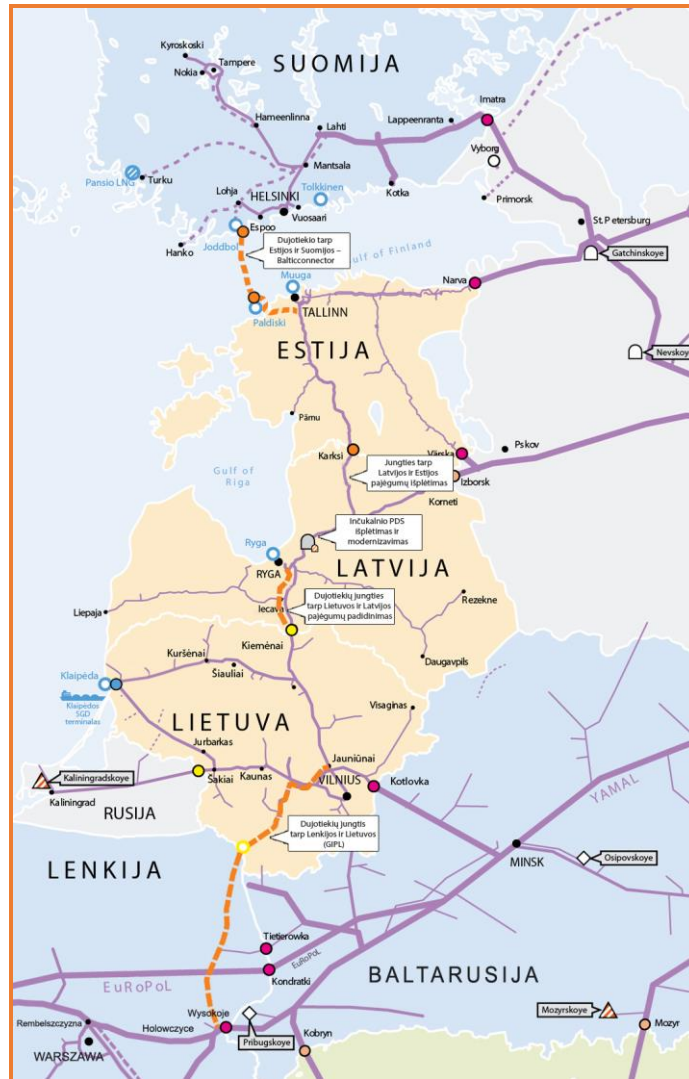
Pav. 5. Rytu Baltijos regiono dujų infrastruktūra, 2018–2027 m.

Baltijos regiono dujų rinkų likvidumui ir konkurencingumui įtaką darys ir Vidurio Rytų ir Pietryčių Europoje vystomi ES bendro intereso projektai, pirmiausia, – tai dujotiekių jungtys tarp Lenkijos ir Slovakijos, Lenkijos ir Čekijos, Lenkijos ir Ukrainos bei su šiais projektais susijusios šalių vidaus perdavimo tinklų pajėgumų padidinimo investicijos.