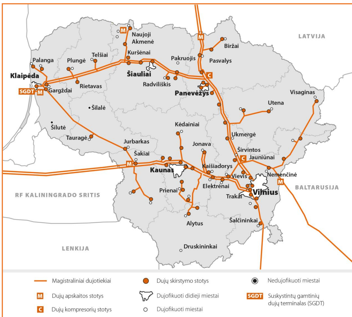
Pav. 4. Lietuvos gamtinių dujų perdavimo sistema, 2018 m.