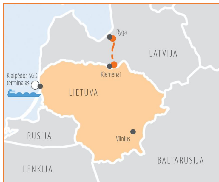
Pav. 7. Dujotiekių jungties tarp Latvijos ir Lietuvos pajėgumų padidinimas

Įgyvendinus projektą būtų išplėsta dujų perdavimo infrastruktūra Lietuvos ir Latvijos teritorijose. Šio projekto vykdytojai – Latvijos gamtinių dujų perdavimo sistemos ir Inčiukalnio požeminės dujų saugyklos operatorius AS „Conexus Baltic Grid“ ir AB „Amber Grid“.